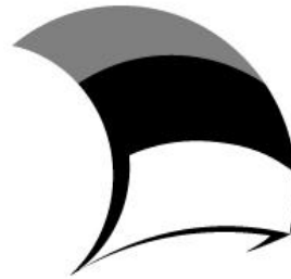
Eesti tuleviku heaks