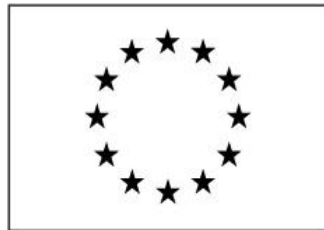
Euroopa Liidu struktuuritoetus