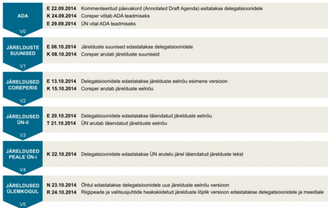
Joonis. Ülemkogu kohtumispõhine ettevalmistus 23.-24.10.2014 kohtumise näitel

Selgitustega päevakord ( Annotated Draft Agenda ; ADA) esitatakse ülemkogule vähemalt neli nädalat enne ülemkogu toimumist. ADA sisaldab peamisi aruteluteemasid, aga on sisult üsna lakooniline (s.o ei anna edasi arutatava sisu, pigem markeerib teemad). ADA arutatakse Coreperis ja üldasjade nõukogus, ent dokumenti ei muudeta (selle käsitlemine pole sõnastamisülesanne) ja teksti parandusettepanekuid ei ole seetõttu mõtet esitada. Küll aga on ADA varajane võimalus teadvustada probleeme ettepanud teemades või tõstatada arutelu vajavaid teemasid (argumenteeritult) ning ka siin kehtib põhimõte, et kui oodatava tippkohtumise valguses on esile kerkimas (ala-)teemasoove või probleeme, tuleks sellest juba varakult teavitada.