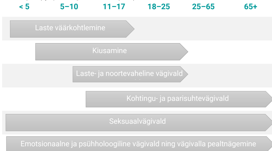
Joonis 2. Kokkupuude vägivallavormidega elukaare jooksul